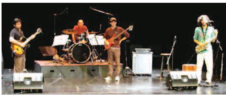
PRESENTES. Participan de importantes eventos en Bogotá.