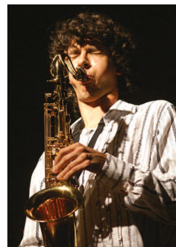
PERUANO. Orgullo nacional.

Sin duda, un talento nacional que deja muy en alto el nombre de La Libertad y el Perú, en tierras colombianas.